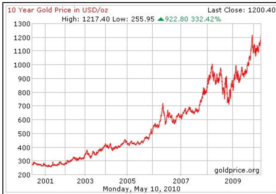
Gambar: Harga emas akan meningkat naik.

Ramai yang teragak-agak untuk memulakan pelaburan emas walaupun tahu ianya sangat menguntungkan dan emas memang naik harga di dalam jangkamasa panjang. Mereka merasakan harga emas "mahal". Ya memang betul emas memang mahal.