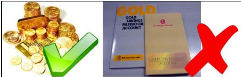
Teknik ini utk pemegang emas fizikal ajer, GIA dan Maybank GSPA tak boleh.

Bagi yang tak ada emas fizikal @ buat pelaburan dengan akaun GIA atau Maybank Gold Saving passbook, teknik ini anda tak boleh buat 😞