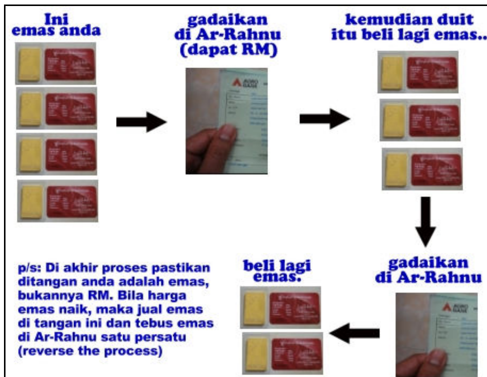
Gambar: Ilustrasi proses pajak emas dan beli emas fizikal.