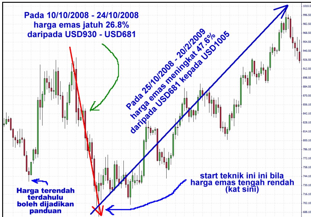
Gambar: Harga emas jatuh 26.8% dalam masa 2 minggu dan melantun semula sehingga 47.6% di dalam masa 4 bulan!

Anda akan mendapat untung apabila harga emas melantun semula. Perhatikan graf dibawah. Kita dapati harga emas boleh jatuh 26.8% dalam masa 2 minggu. Namun selepas itu ia melonjak naik sebanyak 47.6% dalam tempoh 4 bulan.