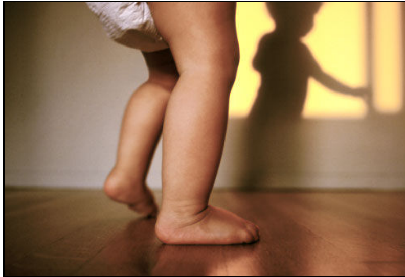
Gambar: Langkah pertama – beli emas dahulu kemudian baru tunggu harga naik.