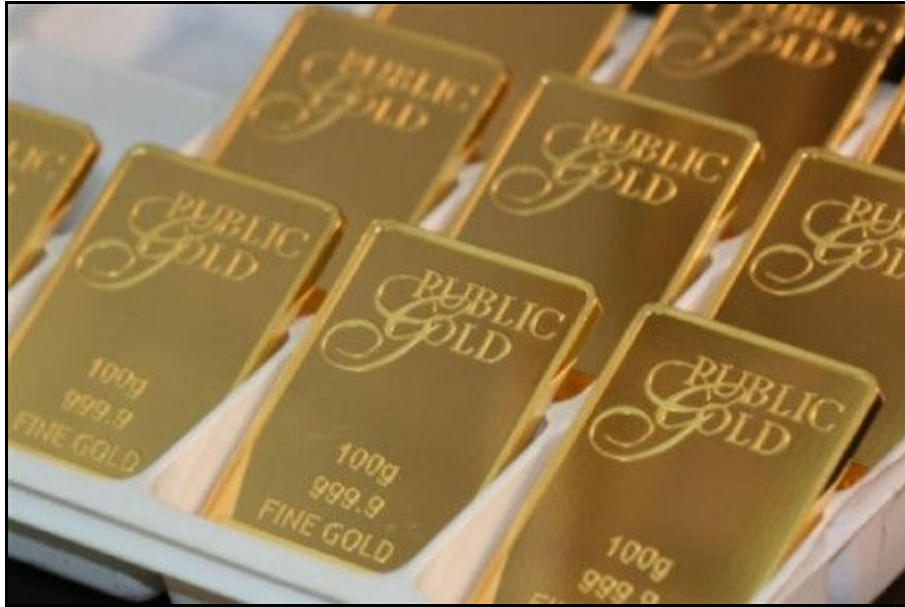
Gambar: Contoh emas fizikal ialah Gold Bar Public Gold.

Baiklah, sekarang saya ingin berkongsi teknik menjana keuntungan dengan menggunakan emas fizikal dan kemudahan Ar-Rahnu. Sesiapa yang dah beli emas fizikal, tahniah! teknik ini untuk anda.